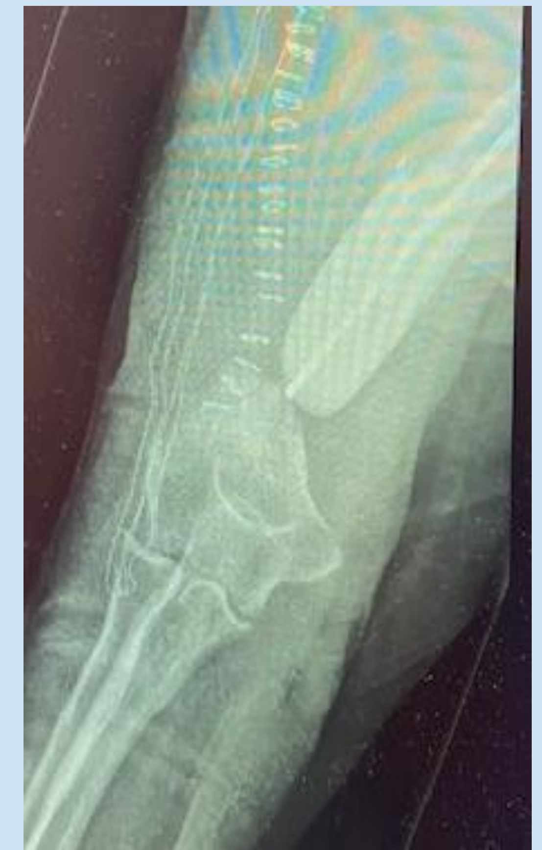
Primer tiempo Qx