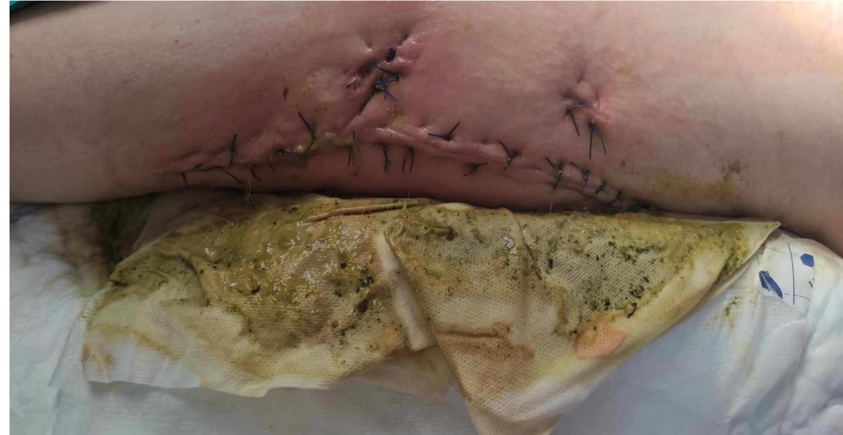
Figura 1: Presencia de material alimentario y fecaloideo drenando por herida.

Presentar el caso de una artritis séptica de cadera por cándida en el contexto de una fístula colon-cadera .