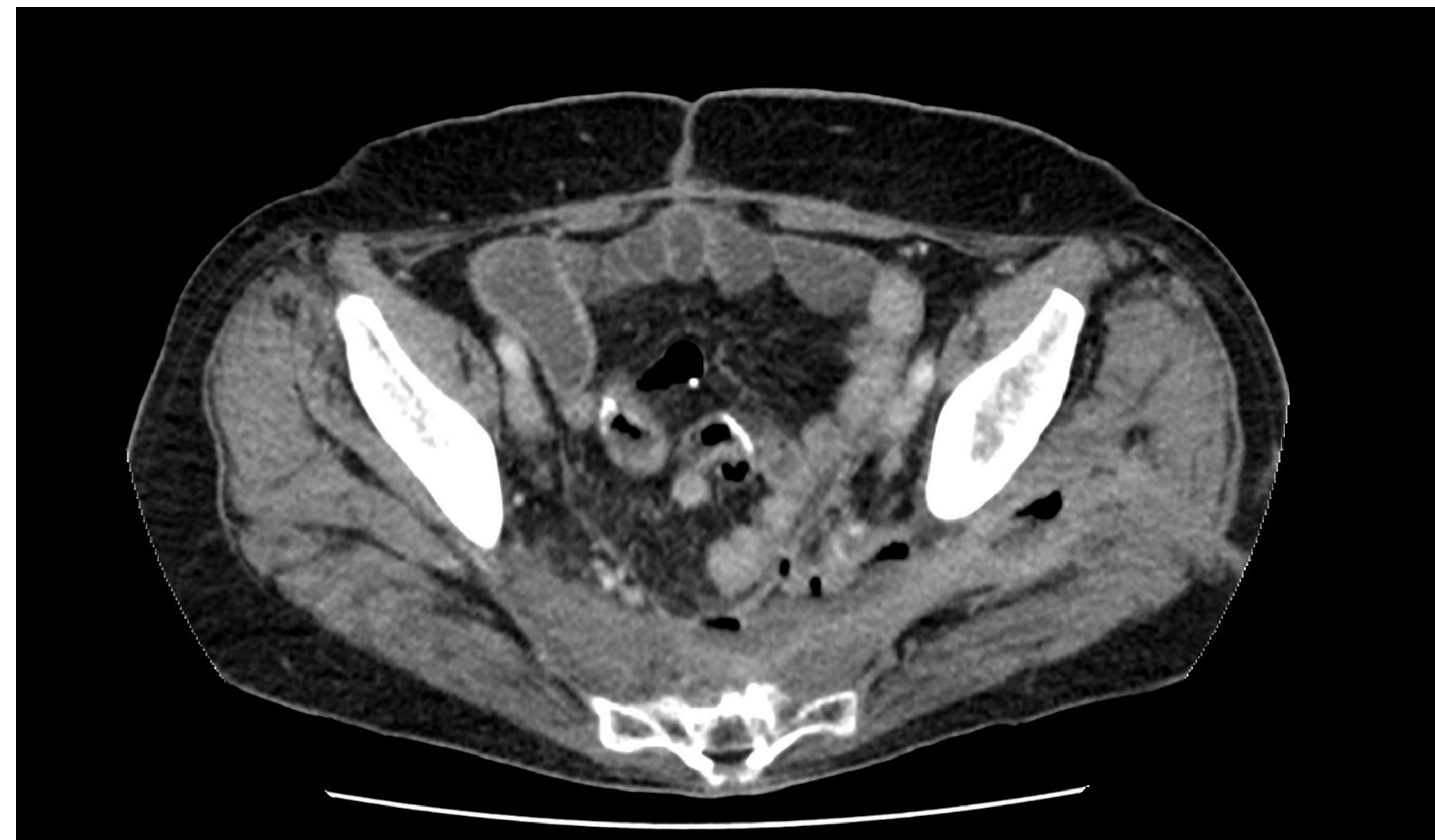
Figura 2: Fistula colon-cadera con presencia de niveles hidroaéreos