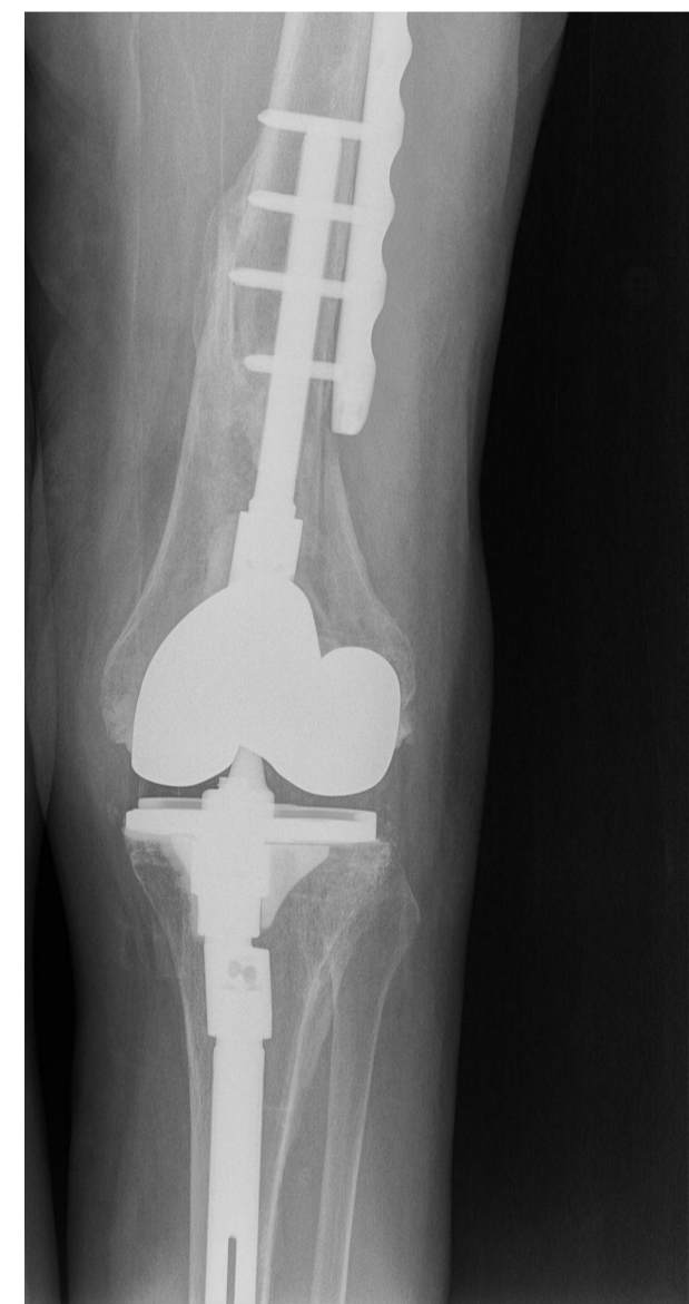
Control radiográfico a los 12 meses